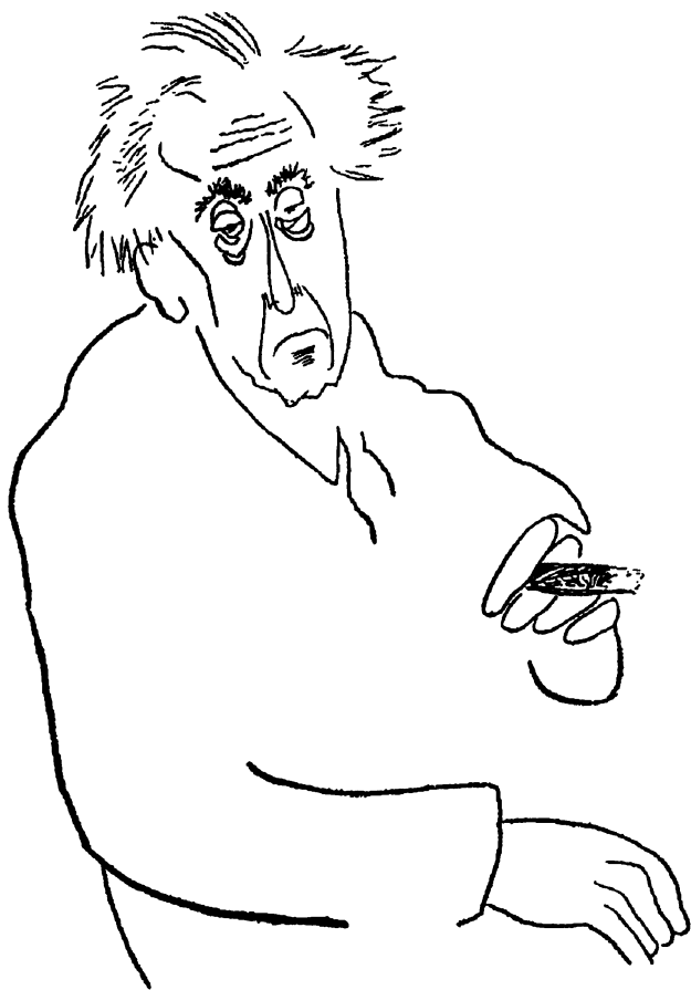
Шарж А. Гоффмейстера