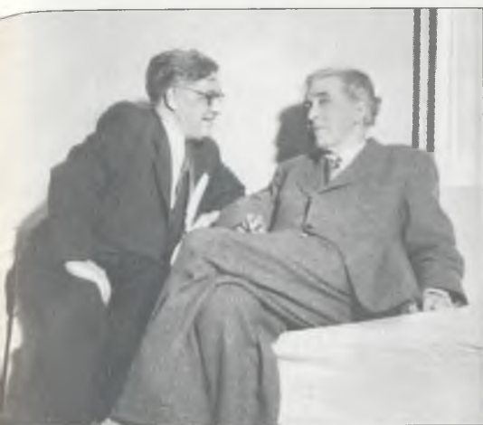
А. Сурков и И. Эренбург. 1954