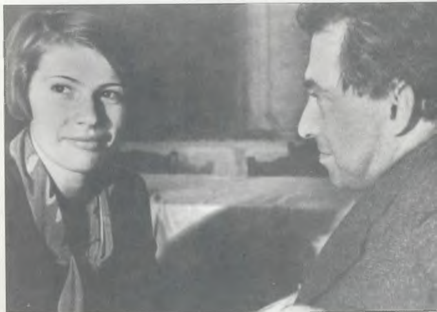
Дуся Виноградова и Илья Эренбург. Москва, 1935