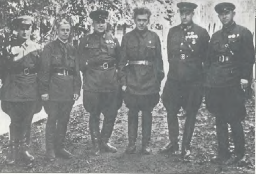
И. Эренбург и К. Рокоссовский (второй справа) на фронте, 1942