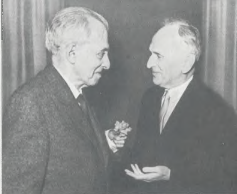
И. Эренбург и В. Лидин. Москва, ЦДЛ, 26 января 1961