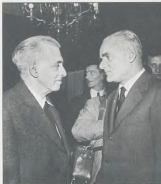
И. Эренбург и А. Моравиа. Рим, 1959