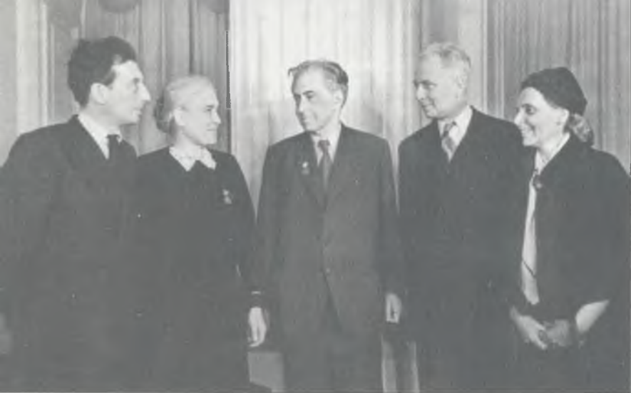
Р. Вайян, А. Зегерс, И. Эренбург, Л. Арагон, Э. Триоле после вручения Эренбургу Международной Сталинской премии. Москва, Кремль, 27 января 1953