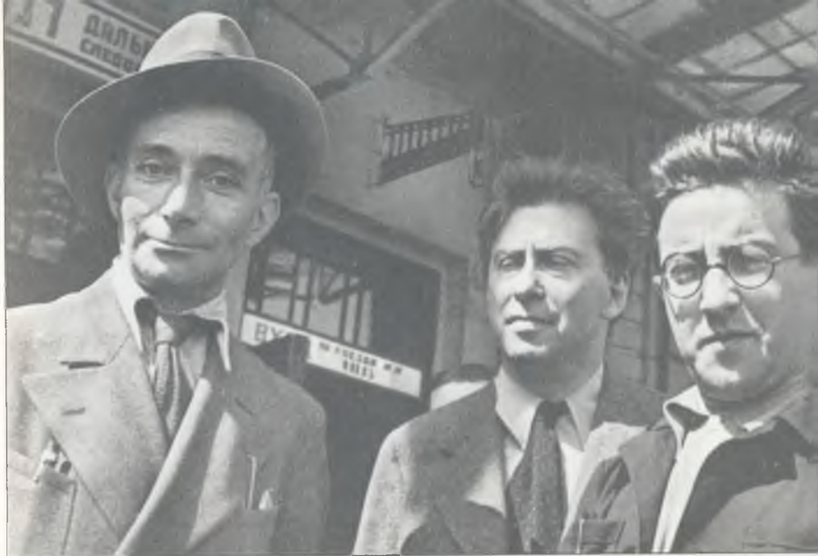
Ж.-Р. Блок, И. Эренбург и М. Кольцов. Москва, 1934