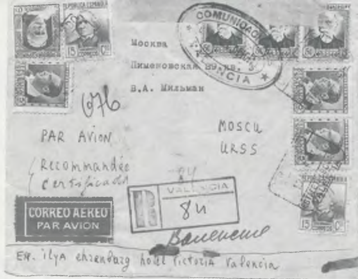
Конверт от письма Эренбурга из Валенсии. Март 1937