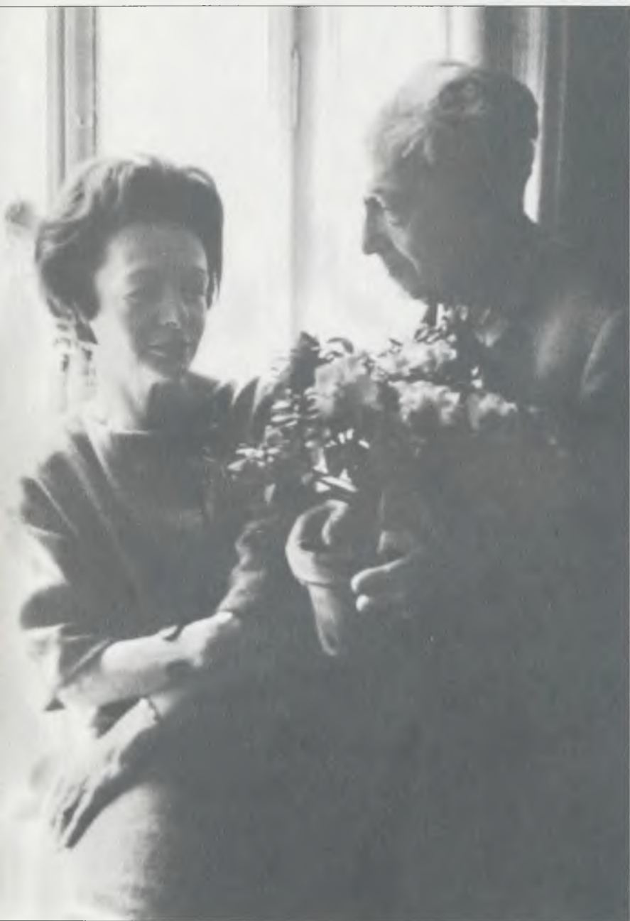
Лизлотта Мэр и Илья Эренбург. Стокгольм, 1961