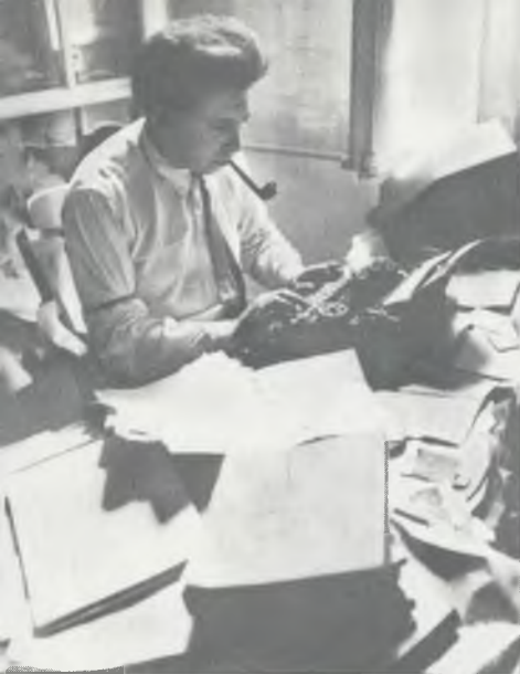
И. Эренбург за работой. Париж, 1932