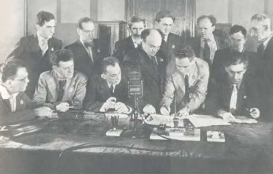
И. Эренбург (за столом справа) на заседании Еврейского антифашистского комитета. Москва, 1941