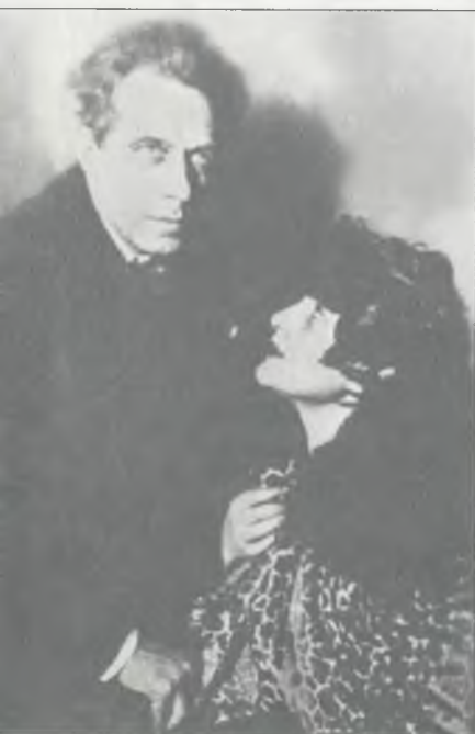
В.Э. Мейерхольд и З.Н. Райх