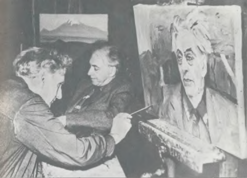
М. Сарьян пишет портрет И. Эренбурга. Ереван, 1959