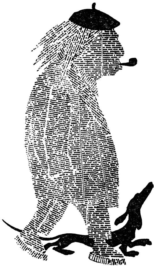
Шарж Б. Пророкова