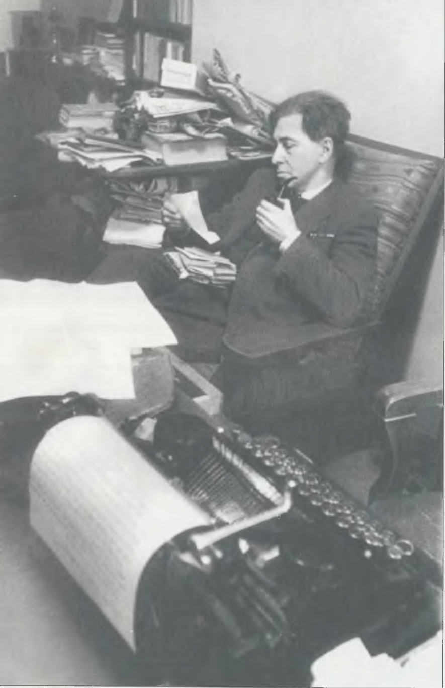
Илья Эренбург за фронтовой почтой. Москва, 2 января 1945