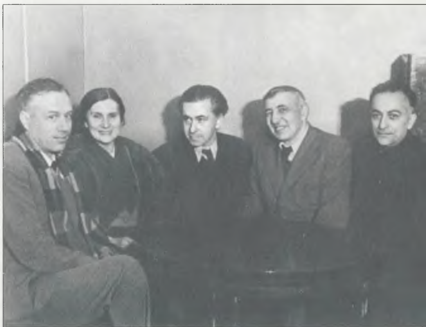
И. Козловский, А. Коонен, И. Эренбург, А. Таиров, Р. Симонов. Москва, 1940