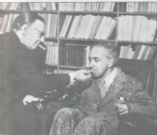
И.Г. Эренбург в гостях у Ж.-П. Сартра. Париж, 1955