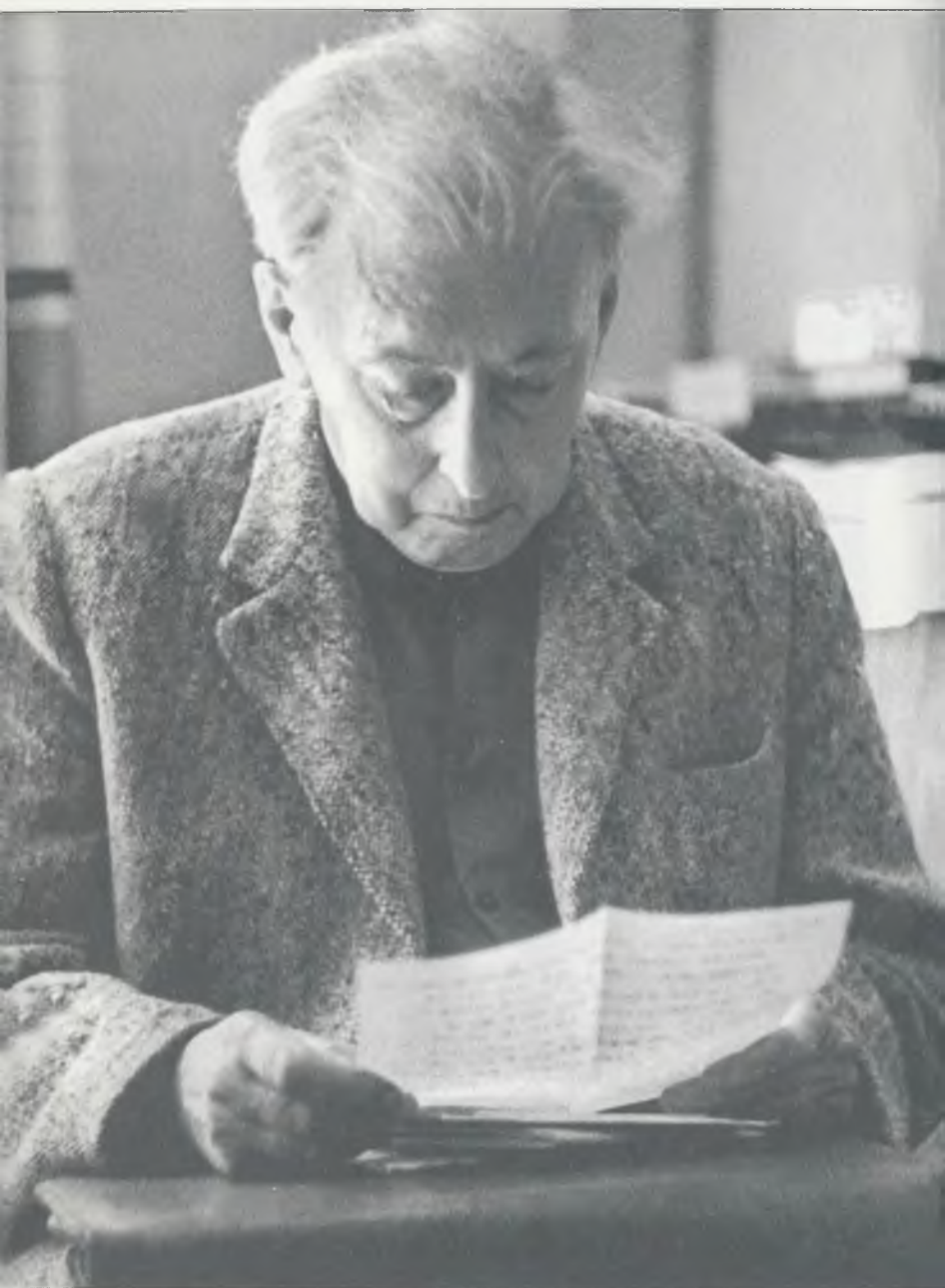
Илья Эренбург на даче за чтением почты (последнее фото). Лето 1967