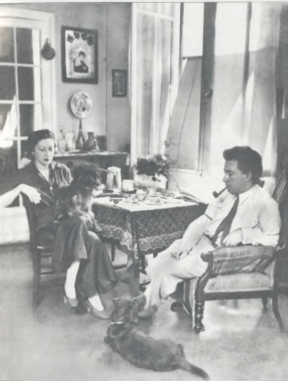
Эренбурги. Париж, ул. Котантен, 1932