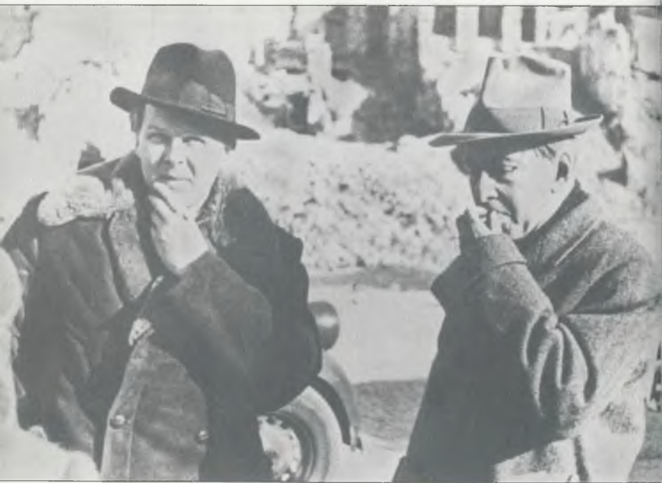
А.Т. Твардовский и И.Г. Эренбург. Варшава, 1947