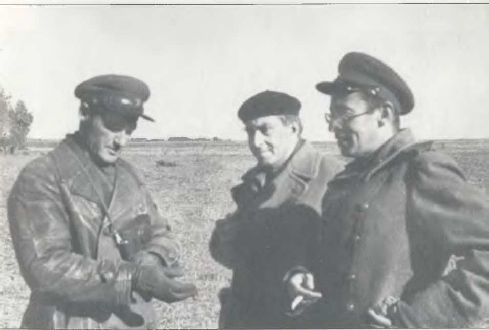
Фотокорреспондент О. Кнорринг, И. Эренбург и В. Гроссман под Киевом, 1943